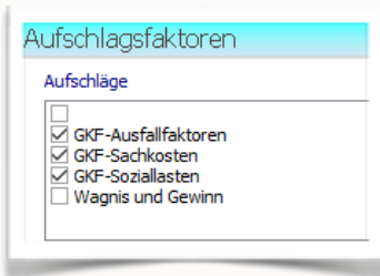
Aufschlagsfaktoren zur Berechnung bestimmen (Versionsabhängig)